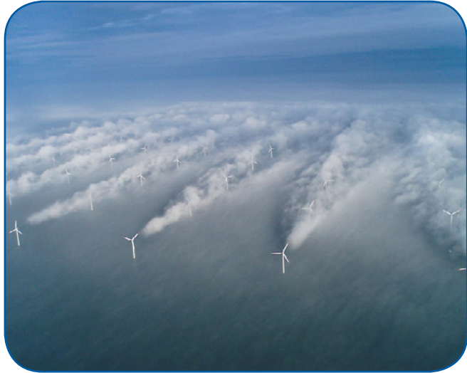
Het Deense windpark Horns Rev

Een foto van het Deense windpark Horns Rev laat dit goed zien. Onder bepaalde weerscondities ontstaan er condensstrepen aan de tippen van de wieken. Op de foto is hierdoor duidelijk te zien dat de wind na het passeren van de wieken gaat wervelen. Er ontstaat turbulentie.